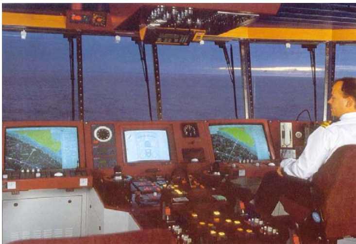
Moderne Schiffsbrücke (ATLAS, 2000)

Entsprechend den oben genannten Aufgaben soll die Gestaltung und Instrumentierung der Brücke ermöglichen, den Zustand der Situation in der Arbeitsumgebung zu beobachten und mit der Arbeitsumgebung – d.h. dem Eigenschiff (Maschinen, Ruder, usw.), anderen Schiffen, Schleppern, Verkehrsdiensten, usw. – zu interagieren.